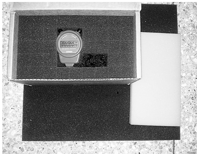
Figura 2. Cronometro en caja utilizada para el transporte

El cronometro viajó en una caja de protección destinada para su traslado. Cada participante usó sus procedimientos normales para el traslado y entrega del equipo.